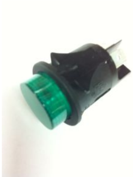
296R Netzschalter rund grün/rund