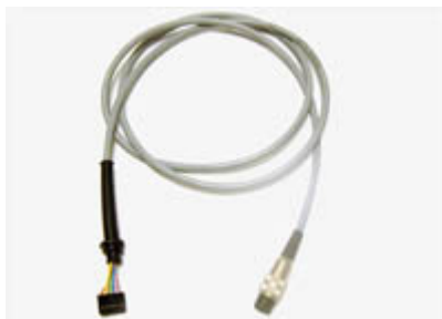
Fußanlasserkabel Vario / FD

248 Kabel mit 8-POL DIN Stecker und Crimp Stecker mit Knickschutztülle Länge: 2 Meter Sonderlängen auf Anfrage!