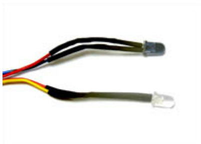
421 Lichtschrankenset Fototransistor und Fotodiode mit Stecker