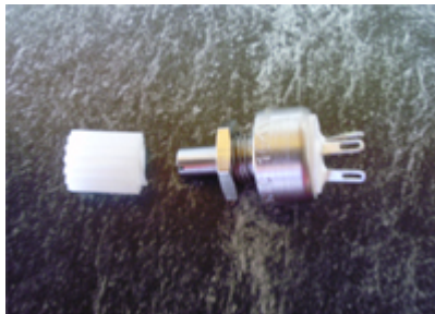
1878 Potentiometer Poti für Vario Fußanlasser mit Zahnrad