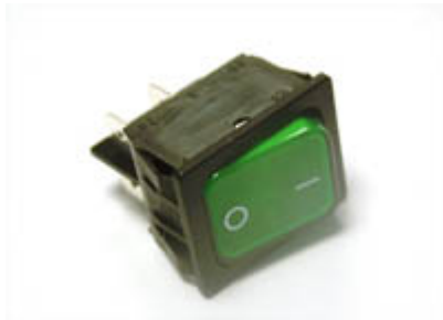
296 Netzschalter grün