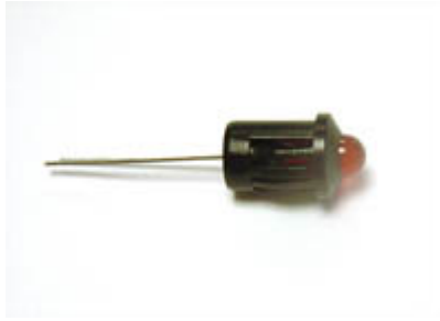
1532 LED mit Fassung rot Kontrolle für Linkslauf bei LE Geräten