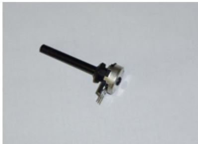
1594 Potentiometer 10K Potentiometer für Fussanlasser