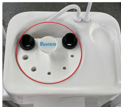
Abb 1 Thomas Instrumenten-Spüleinsatz