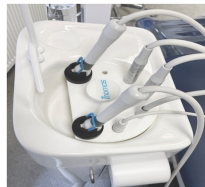
Abb 2 Thomas Instrumenten-Spüleinsatz mit eingesteckten Instrumenten